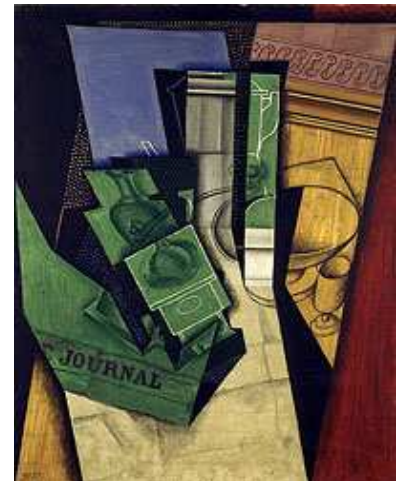
Juan Gris, Le Petit déjeuner , 1915

Retour de la couleur. Plans colorés simples, mis à plat. Technique du collage (papiers, objets, faux bois...). Lisibilité plus facile de l'objet qui est représenté sous ses traits essentiels, de façon « synthétique ». Abandon du volume et de la perspective.