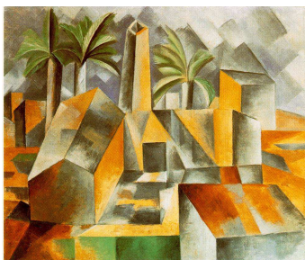
Pablo Picasso, Usine à Horta de Ebro , 1909