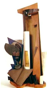
Une sculpture cubiste : Henri Laurens, Bouteille et verre , 1918 (assemblage de bois et de tôle) (Cubisme synthétique)