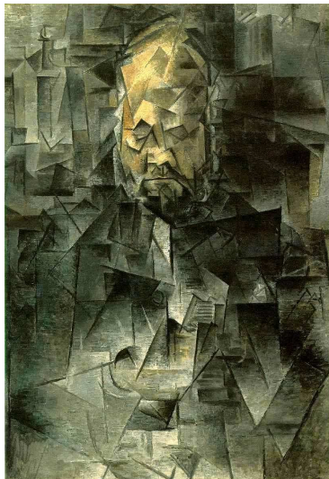
Pablo Picasso, Portrait d'Ambroise Vollard , 1910 (Cubisme analytique)